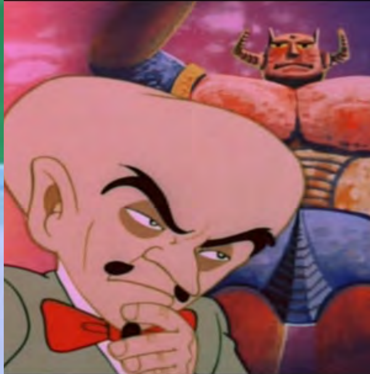
태권브이의 악당 카프 박사